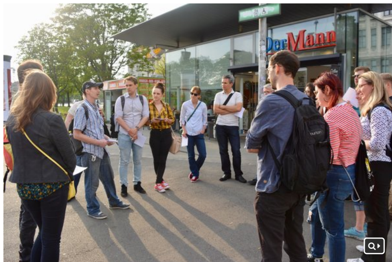
Jeder darf seine eigenen Geschichten und Erfahrungen einbringen.